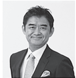
一般社団法人ブロックチェーン推進協会 代表理事

なお当日は、講師の方々の他、ブロックチェーン推進協会の会員の方も多数参加する予定であり、関連業界の第一線の皆様が集まる数少ない貴重な機会となります。会の最後には懇親会も用意しておりますので、情報交換や人脈作りの絶好の場としてもご利用いただければ幸いです。